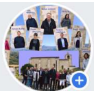
Aiglun Mairie 04510 @aigluninfos

La commission communication, dès la première réunion, a validé la création d'une page facebook ( @aigluninfos ) ainsi que la refonte du site internet de la mairie. De nouveaux outils indispensables qu'il nous faut apprendre à utiliser pour mieux informer !