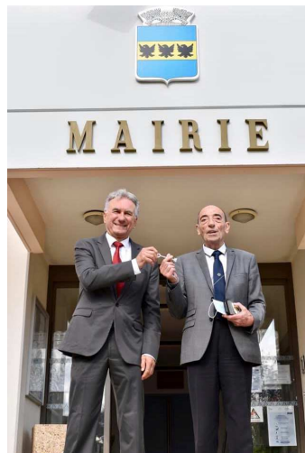
Remise des clés de la mairie après le conseil municipal du 27 mai 2020

Cette nomination met à l'honneur 37 années d'engagement de notre ancien maire auprès des Aiglunais, et la volonté conjointe d'une transmission réussie.